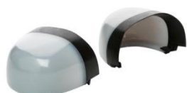
Puntera no metálica