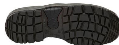
Suela Antiestática + Resistente a los hidrocarburos